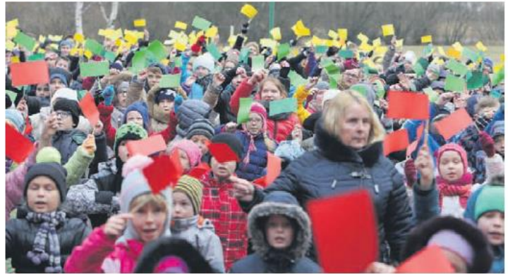
■ Naujovė: nuo rugsėjo 1-osios priemiestyje gyvenantys, bet Klaipėdoje besimokantys moksleiviai jau gali įsigyti terminuotus mėnesinius autobuso bilietus.

„Jei vaikas, pavyzdžiui, atvyksta iš Priekulės, kur yra mokykla, mokytis į Klaipėdą, mes važiuojimo išlaidų nekompensuojame“, –