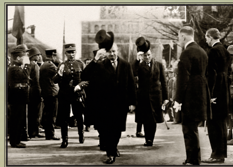
Lietuvos Respublikos prezidentas Aleksandras Stulginskis atvyksta į Karo muziejų. Kaunas, 1925 m.