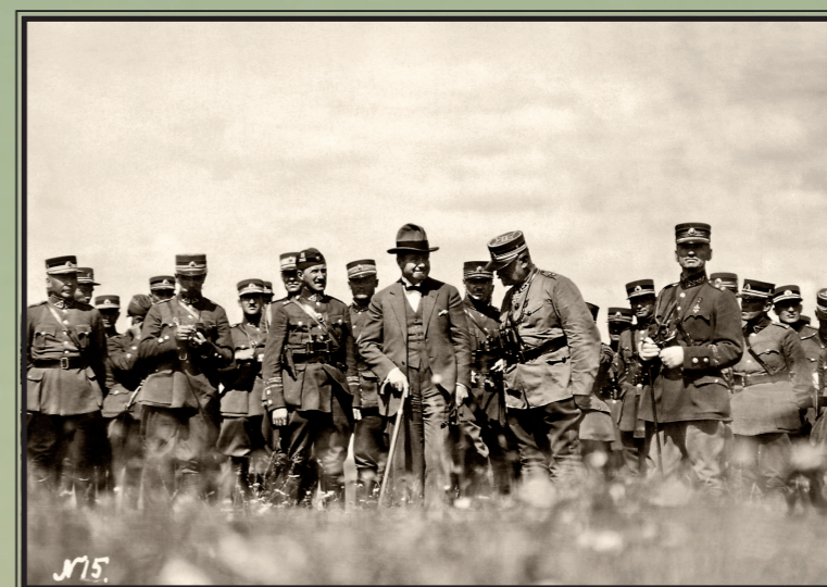
Lietuvos Respublikos prezidentas Aleksandras Stulginskis su Lietuvos kariuomenės karininkais stebi Aukštųjų karininkų kursų klausytojų pavyzdinius manevrus. Varėna, 1924 m.

„Aš, Aleksandras Stulginskis, prisiekiu Visagaliui Dievui, trejybėje Vienam Esančiam, visomis savo pajėgomis rūpintis Lietuvos ir tautos gerove, saugoti Konstituciją ir įstatymus, sąžiningai eiti savo pareigas ir būti visiems lygiai teisingas. Taip man Dieve padėk. Amen.“