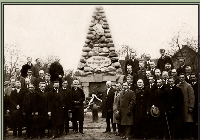
Lietuvos Respublikos Steigiamojo Seimo nariai Karo muziejaus sodelyje prie paminklo „Žuvusiems už Lietuvos Laisvę“. Centre dešinėje Steigiamojo Seimo pirmininkas, einantis Lietuvos Respublikos prezidento pareigas Aleksandras Stulginskis. Kaunas, 1922 m. gegužės 15 d..

1922 m. gruodžio 21 d. Lietuvos Respublikos Prezidento A. Stulginskio priesaika: