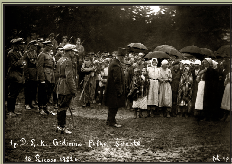
Lietuvos kariuomenės 1-ojo pėstininkų Lietuvos didžiojo kunigaikščio Gedimino pulko šventė Gelvonuose dalyvaujant Steigiamojo Seimo pirmininkui, einančiam Lietuvos Respublikos prezidento pareigas Aleksandrui Stulginskiui (centre). Sirvintų r., 1921 m. liepos 16 d.