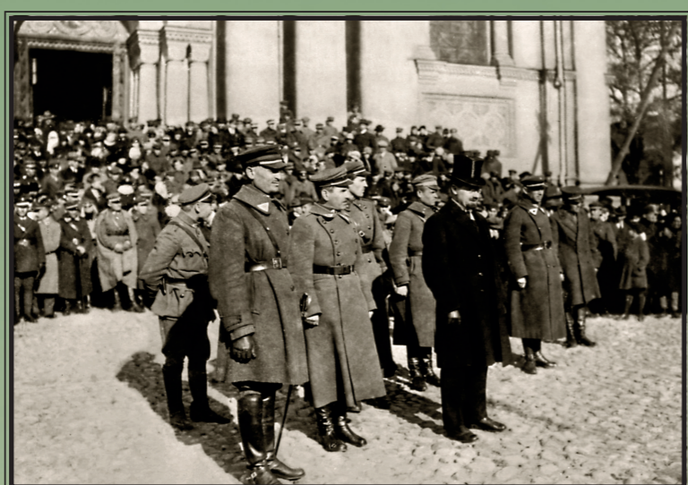
Karo mokyklos trečiosios kariūnų laidos išleistuvių iškilmės. Priekyje – Steigiamojo Seimo pirmininkas, einantis Lietuvos Respublikos prezidento pareigas Aleksandras Stulginskis. Kaunas, 1920 m. spalio 17 d.

Steigiamojo Seimo pirmininkas, einantis Lietuvos Respublikos Prezidento pareigas (1920 06 19 – 1922 12 21) Lietuvos Respublikos Prezidentas (1922 12 21 – 1926 06 07)