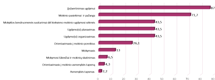
2 pav. (Iš)vertinimas ugdymui labiausiai tobulintinas mokyklų veiklos aspektas Tobulintini mokyklos veiklos aspektai (mokyklų dalis proc., N=46)

(Iš)vertinimo ugdymui arba formuojamojo vertinimo paskirtis – skatinti kiekvieno mokinio individualią pažangą. Mokyklose taikoma vertinimo sistema vis dar pernelyg orientuota į žinių ir tam tikrų gebėjimų fiksavimą pažymiu, užribyje paliekant įvairias bendrųjų kompetencijų vertinimo formas ir metodus. Ugdymo(si) procese per mažai dėmesio skiriama naudingų patarimų kaip mokytis teikimui. Vertinamojo pobūdžio grįžtamasis ryšys, kai mokiniai lyginami tarpusavyje, neskatina mokinio kelti tikslus, tobulėti,