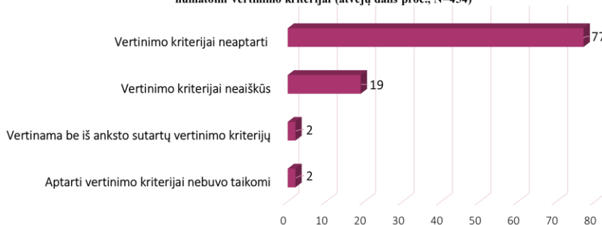
3 pav. Tobulintinėse tradicinėse pamokose mokiniai neinformuojami, su jais neaptariama, kokie numatomi vertinimo kriterijai (atvejų dalis proc., N=454)

Pamokoje reflektuoti skatinami mokiniai turi galimybę įsivertinti ir apmąstyti savo mokymąsi, prisiimti atsakomybę už savo mokymosi veiklą ir rezultatus. Mokiniams teikiamas veiksmingas grįžtamasis ryšys mokymosi procese tyrėtų būti savalaikis, tikslus ir nevertinantis, nurodantis tobulėjimo, mokymosi kliūties įveikimo kryptį.