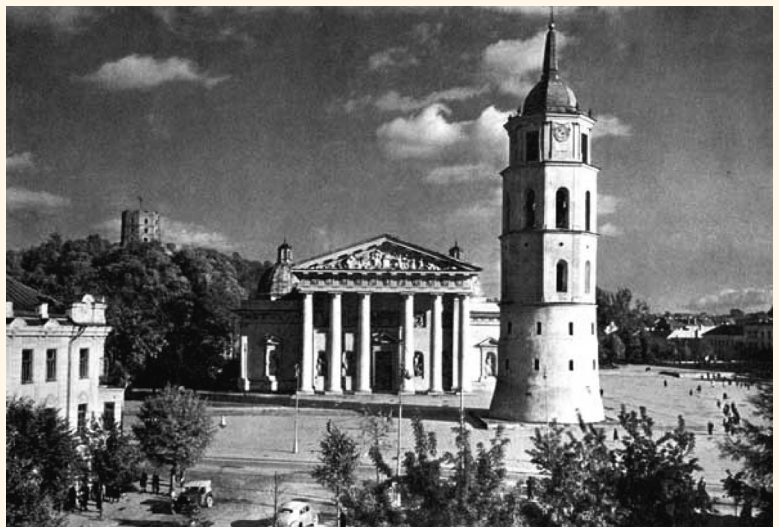
Katedros aikštė 1950 m.