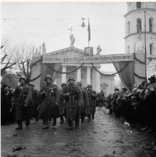
Katedros aikštė 1939 m.

Kristina Nestlinger „Pirmadienį viskas kitaip“