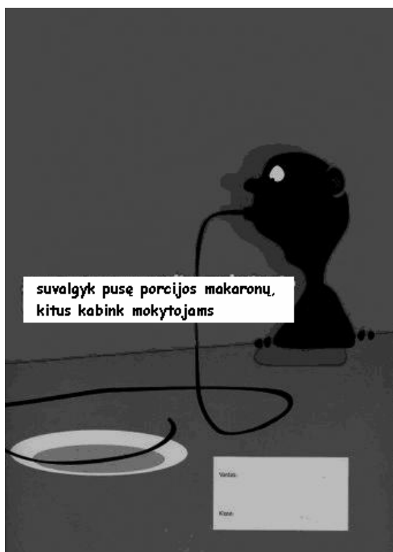
Mobiliojo ryšio reklama ant sąsiuvinio viršelio