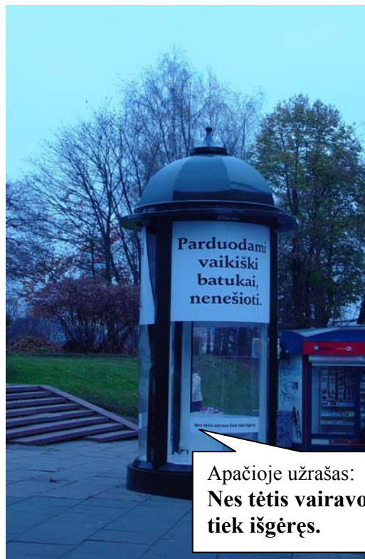
Stendas Vilniaus gatvėje

Pastaba. Parašę nepamirškite suskaičiuoti žodžių ir parašyti jų skaičiaus paraštėje.