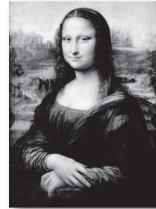
Leonardo da Vinči „Mona Liza“

6 Kuriuo laikotarpiu nutapytas šis paveikslas?