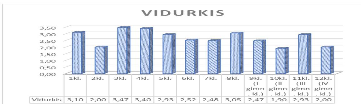
2 pav. Apibendrintas pamokos vidurkio vertinimas pagal klases (N=37)

1–5 lentelėse pateikti kiekvieno stebėto pamokos aspekto apibendrinti vertinimai pagal vertinimo lygius. Daugiausiai aukščiausiu lygiu stebėtose pamokose įvertinta ugdymo(si) aplinkos (37,83 proc.). Daugiausiai patenkinamu lygiu įvertinti šie pamokos aspektai: vertinimas ugdant (62,16 proc.), kiekvieno mokinio pažanga ir pasiekimai (54,05 proc.), mokymosi patirtys (51,35 proc.). Remiantis šiais duomenimis gimnazija gali planuoti veiklos tobulinimo prioritetus: kryptingai tobulinti kvalifikaciją, gerosios patirties sklaidą, mokymąsi „Kolega – Kolegai“, įtraukiojo ugdymo įgyvendinimo veiklas, tobulinti pamoką ir kt. .